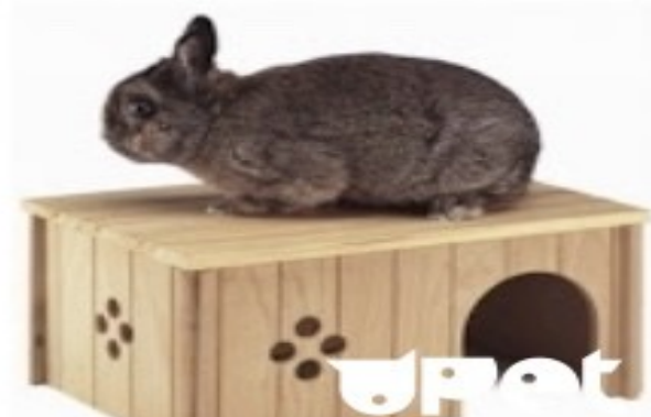
домик для отдыха и прятки