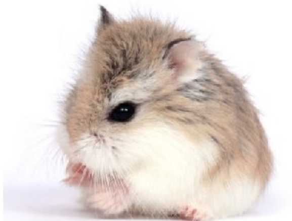
Карликовый хомяк Тейлора