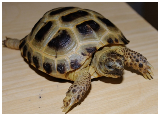
СРЕДНЕАЗИАТСКАЯ ЧЕРЕПАХА \

Среда обитания: родоначальниками обычных ручных крыс были серые азиатские крысы – пасюки. В Европу они впервые попали в XVI, XVII веках, составив конкуренцию местным черным крысам.